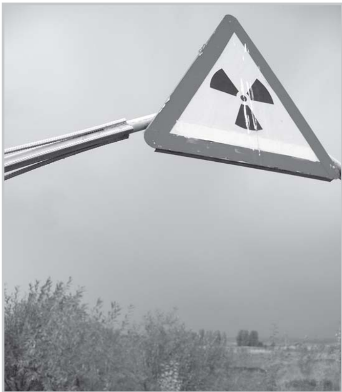
Аллея жертв радиации, Челябинская обл., близ деревни Муслиумово, сентябрь 2007. Рашид Алимов.

Редакция интернет-издания «Беллона.ру» для написания статьи направила журналистский запрос в Комитет по экологии Государственной думы РФ с просьбой разъяснить причины не принятия необходимых для страны природоохранных законов. Ответа из Комитета не поступило, что явилось основанием для обращения в суд с заявлением о признании такого бездействия незаконным. Дело рассматривается судом.