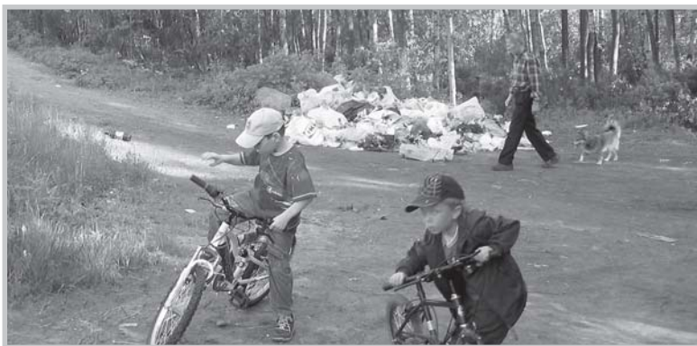
Буферная зона Юнтоловского заказника в Санкт-Петербурге.

Данное право регулирует отношения, возникающее в системе «человек, его жизнь и здоровье — окружающая среда».