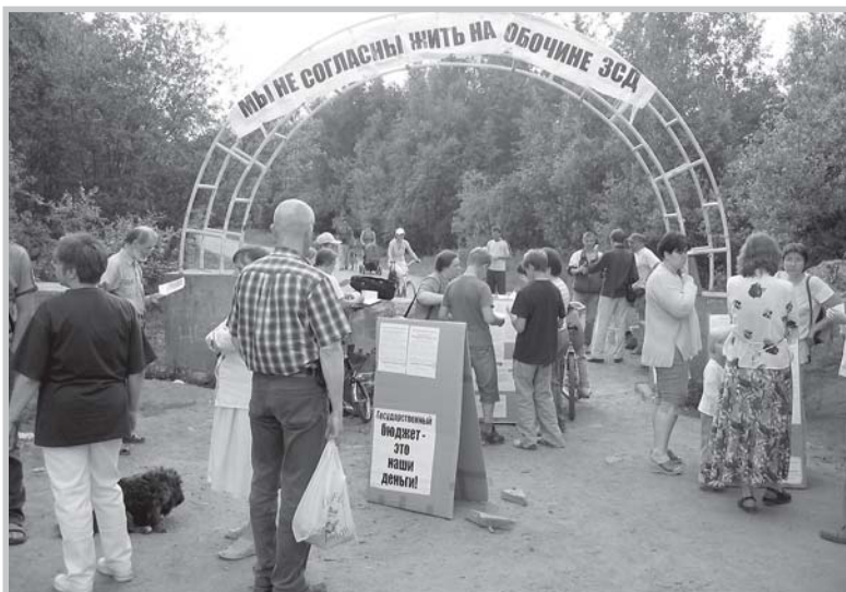
Акция общественного движения «Сохраним Юнтолово».

Действующий Федеральный закон от 19.05.1995 № 82-ФЗ «Об общественных объединениях» допускает реализацию права граждан на объединение как непосредственно путем объединения, так и через юридические лица.