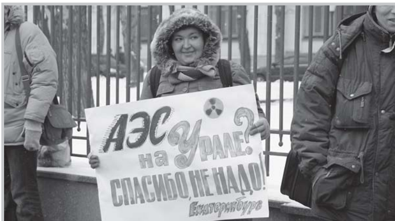
Пикет экологов у Росатома против строительства новых АЭС.

Участники публичного мероприятия вправе принимать и направлять резолюции, требования и другие обращения в органы госу-